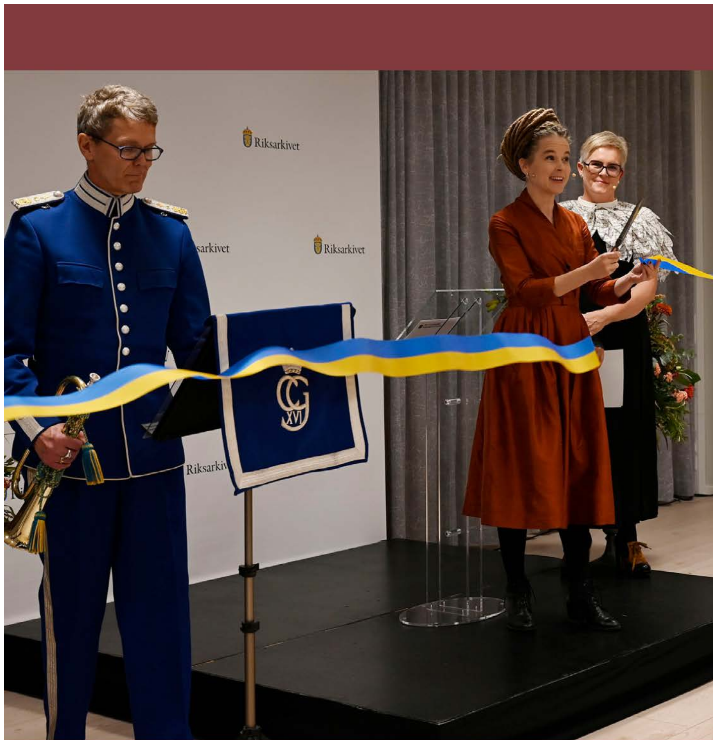
Invigning av Riksarkivet i Täby firades den 1 oktober 2021, med fanfar och invigningstal av kulturminister Amanda Lind.